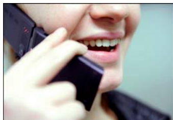
ЕС подготвя ново намаляване на цените на разговорите в роуминг

С новия европейски регламент за изходящи и входящи разговори по мобилен телефон в чужбина (в рамките на ЕС), влязъл в сила през 2007 година, цените за телефониране в роуминг значително намаляха за милиони европейци. От лятото на 2009 година се подготвя ново намаляване на цените на разговорите и въвеждане на горна граница за цените на текстовите съобщения SMS.