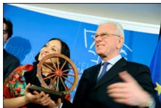
Ханс-Герт Пьотеринг получава наградата за Европейския Парламент

Председателят на ЕП Ханс-Герт Пьотеринг получи на 2 април 2009 г. награда за приноса на Парламента (в неговия мандат 2004-2009) за защита на ромите в Европа и техните права. Наградата връчиха представители на водещи ромски организации в Европа от името на ромската общност. Отличието идва в навечерието на Международния ден на ромите, 8 април. За повече информация натиснете ТУК