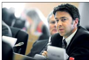
Billy Costacurta в ЕП

Продаването и купуването на футболисти е всекидневна практика за големите клубове. Но кой определя правилата за това? Евродепутати се срещнаха в понеделник с футболисти, мениджъри и юристи, за да обсъдят трансферите, статута на чуждестранните играчи и защитата на младите спортисти. За повече информация натиснете ТУК